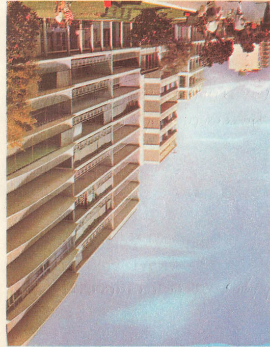
Ancón (Lima) Peru