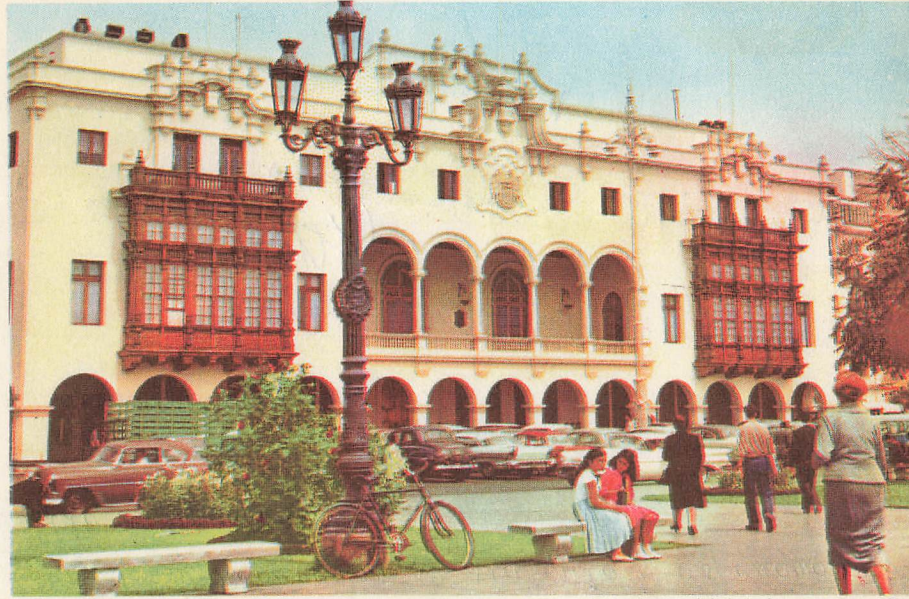
Municipalidad de Lima Lima Peru

Carta-Sobre. PERU EN COLOR modelo patentado Exp. 31-P.893 reprod. prohibida: IBERIA S. A. Distribuye INCA - Ayacucho 154 Telf. 75347 - Apartado 3115 LIMA - PERU