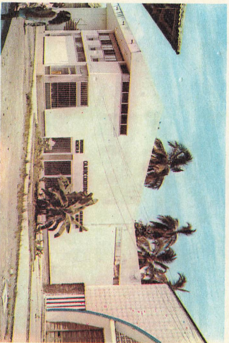
CAJA DE CREDITO AGRARIO