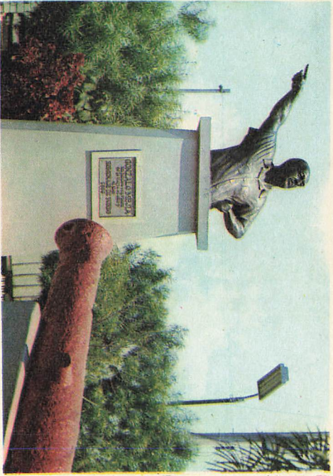
MONUMENTO A GONZALO MEJIA

REMITE: Comisista Nunez Y Tuleo Foto "CIVOS DEL DARIEN"