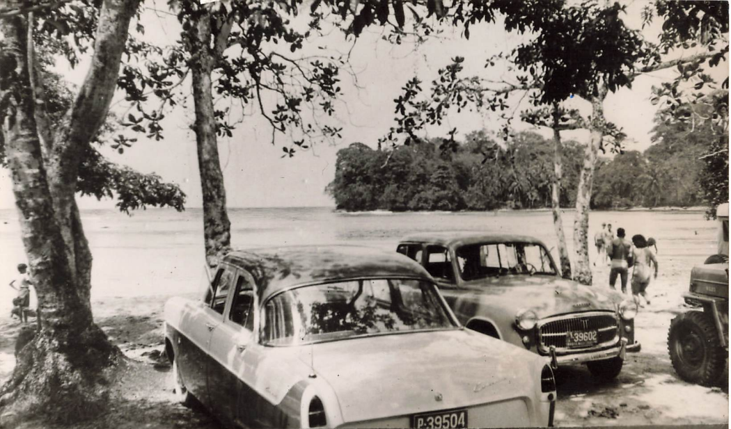
BALNEARIO DE PORTETE - PUERTO LIMON, COSTA RICA