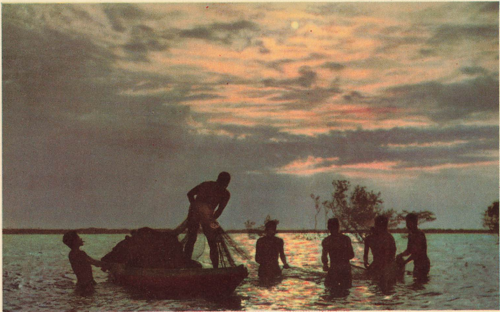
Pescaria no Rio Negro